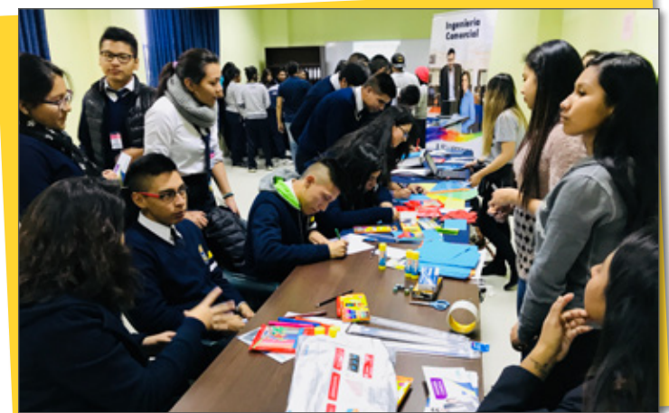
Ideas en el área de Ciencias Empresariales