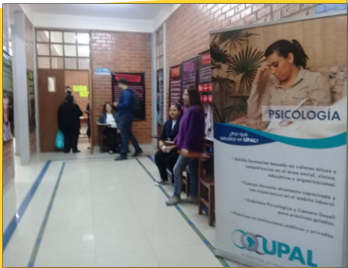
Psicología - Material sobre patologías y trastornos