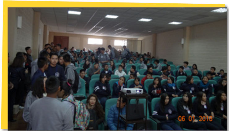
¡Listos para empezar! Un primer encuentro en nuestro Auditorio

Un aplauso para todos quienes participaron de esta actividad coordinada desde la Dirección de Marketing, que contó con el apoyo de todas las carreras, así como con el equipo de Bienestar Universitario y un importante número de becarios.