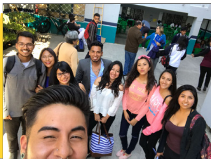
Estudiantes que son parte del Elenco de Teatro de la UPAL

Durante el proceso de capacitación Integrantes del grupo de teatro de la UPAL presentaron escenificaciones que reflejaron distintas circunstancias "cotidianas" de discriminación y violencia, con la finalidad de cuestionar actitudes que solemos ver en nuestro entorno.