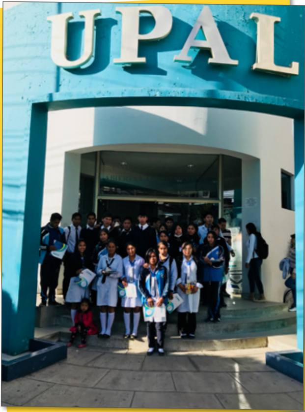
¡Un recuerdo! ¡Una gran posibilidad!