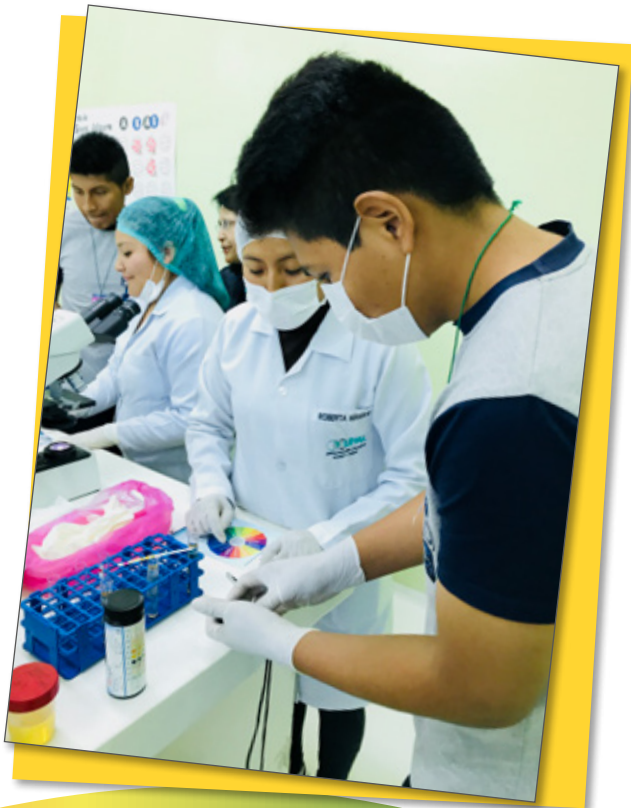
Reacciones en Laboratorio