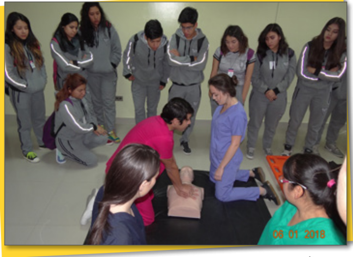
¿Cómo aplicar técnicas de reanimación? - Área médica