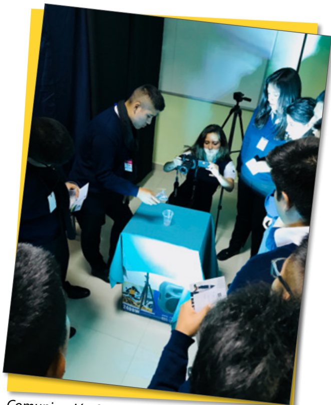
Comunicación Social - Laboratorio fotográfico