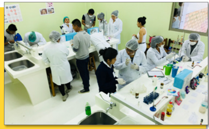
Experimentando en el Laboratorio de Bioquímica y Farmacia