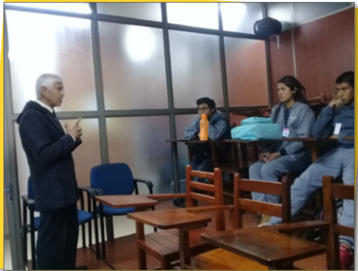
Psicología - Conociendo cómo funciona la Cámara Gesell