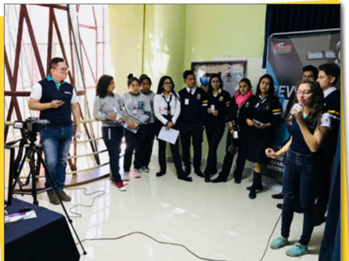
Experiementando con la transmisión en TV al vivo