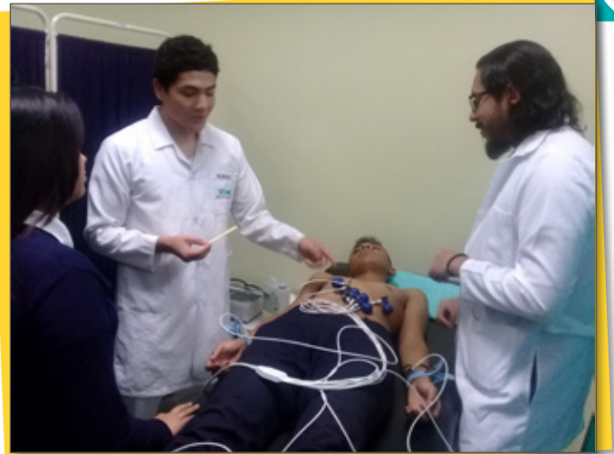
Atención médica Identificando señales con el uso de equipo especializado.