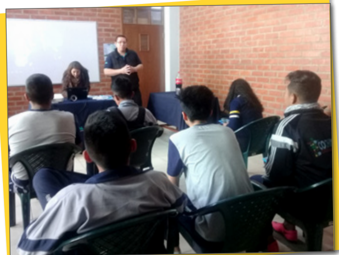
Carrera de Derecho