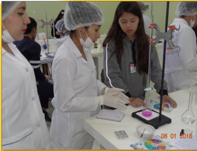
Reacciones químicas en Laboratorio