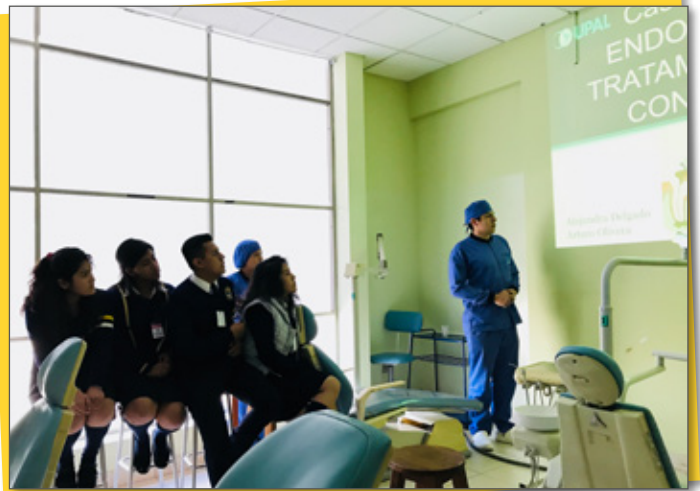
Experiencias en la Clínica Odontológica