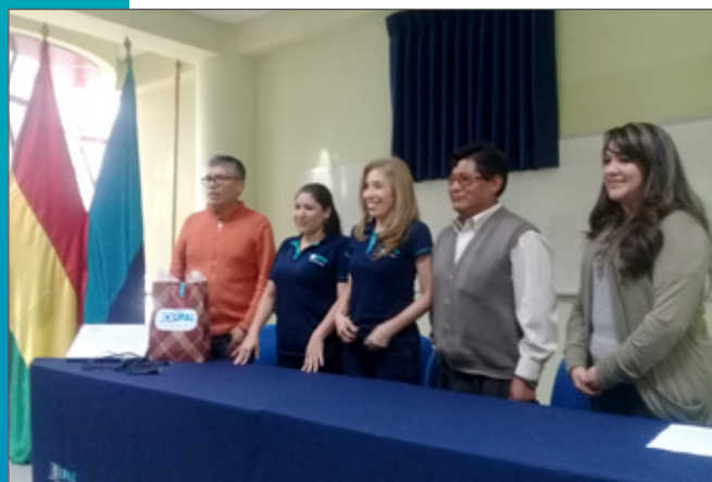
Algunas de nuestras autoridades al momento de conocer la aprobación de la Certificación

Una gran noticia que nos acompañó poco antes de finalizar el semestre fue la aprobación institucional de la auditoría externa de Upgrade para la migración a la ISO 9001:2015, a través de la TÜV Rheinland como ente certificador.