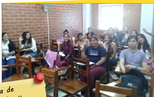
Carrera de Bioquímica y Farmacia