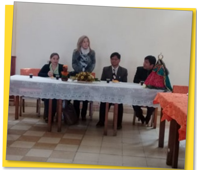
Momentos de agradecimiento y regocijo