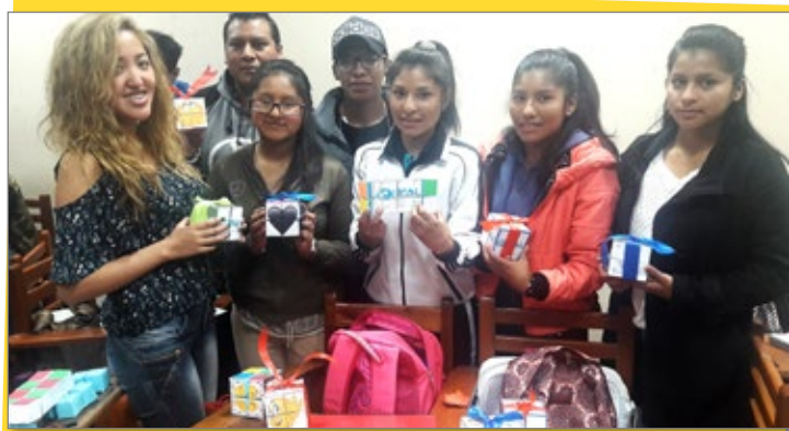
Estudiantes de Administración Estratégica de Empresas Oruro