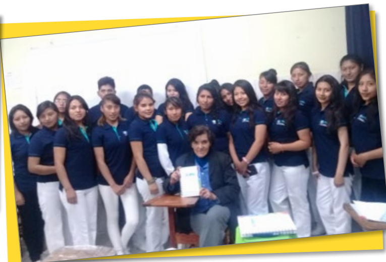
Estudiantes de Enfermería Oruro