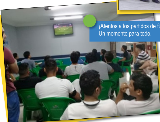
¡Atentos a los partidos de fútbol! Un momento para todo.