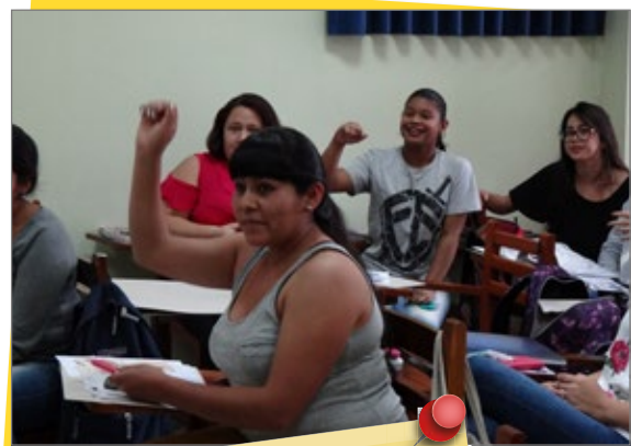
Carrera de Odontología