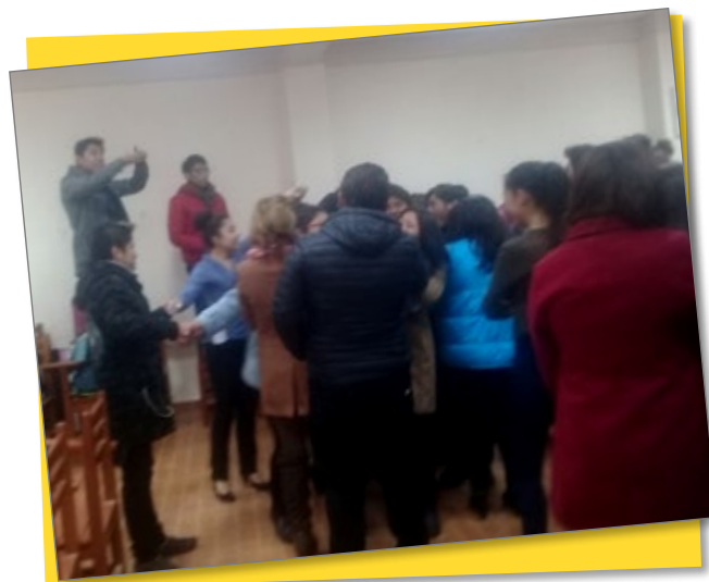
Estudiantes de Psicología Oruro