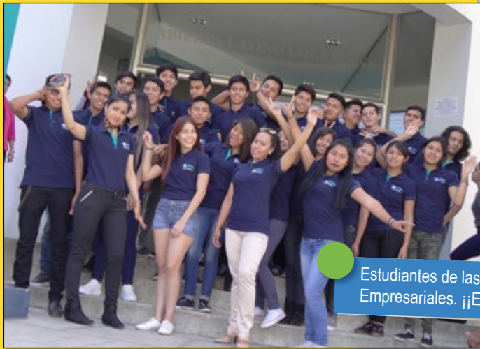
Estudiantes de las carreras de Ciencias Empresariales. ¡¡Energía total!

Algunos momentos captados en nuestra casa