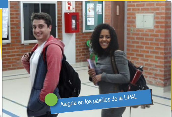
Alegría en los pasillos de la UPAL