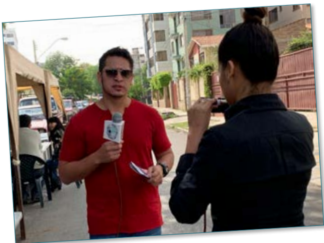
El programa de "Sintonía UPAL" haciendo cobertura a la Feria de la Salud.