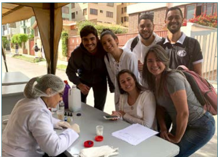
Tipificación sanguínea, conociendo información de interés a partir de tomas de muestras.