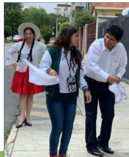
Una estudiante el "Jaime Escalante" compartiendo una cuenca con miembros de nuestro Ballet Folklórico UPAL.