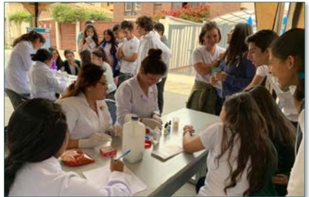
Estudiantes de la Unidad Educativa Jaime Escalante y vecinos de la zona, durante la Feria.