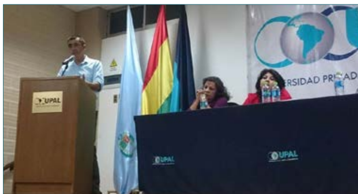
Panelistas invitados a la sesión del 10 de abril.