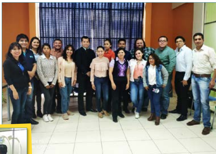
Participantes y jurado del Concurso de Debate Intercarreras