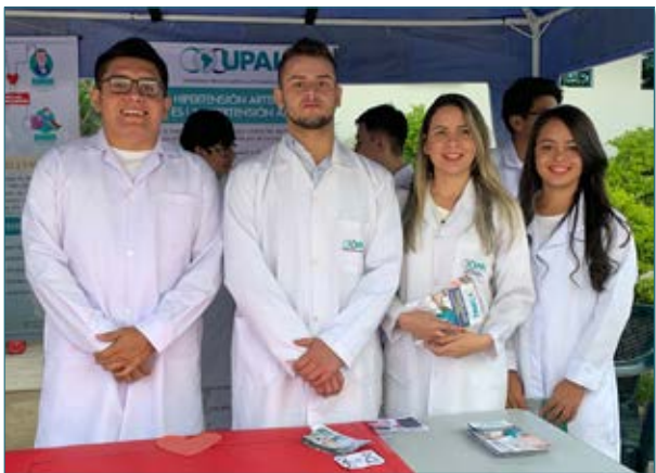
Nuestros estudiantes brindando lo mejor de sí en favor de la comunidad.