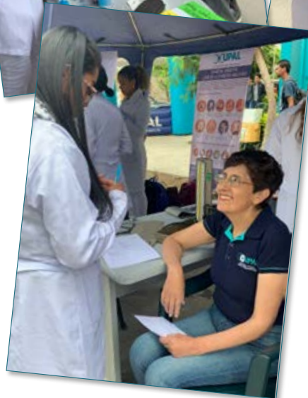
Llegamos también a nuestro personal, nuestros estudiantes, docentes y colaboradores, quienes se beneficiaron con las distintas pruebas gratuitas realizadas.