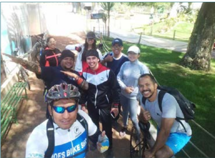
En el Parque Cretácico, todos con buen ánimo y probando la resistencia.