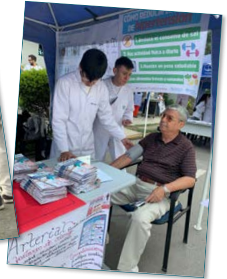
La Feria de la Salud permitió llegar a un número importante de adultos mayores de la zona.