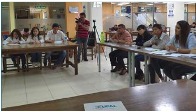
Participantes durante el Concurso de Debates intercarreras.