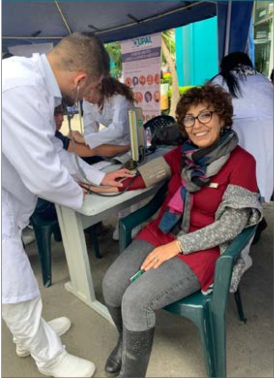
No faltó el buen ánimo de quienes nos visitaron y la actitud profesional y de servicio de nuestros estudiantes, supervisados y animados por sus docentes.