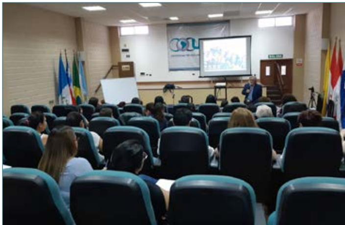
El Dr. Bolatti compartiendo parte de su amplia experiencia profesional con los profesionales participantes del Diplomado.