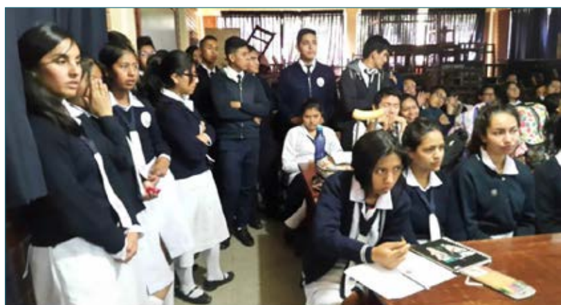
Estudiantes de la Unidad Educativa "Elena Arze" que participaron de la actividad.