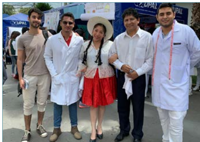
Comunidad UPAL, ciencia, servicio y cultura.