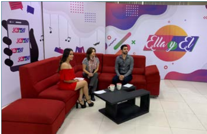
Promoción de la actividad en medios de comunicación de radio y TV