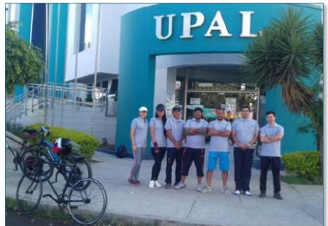
Listos para partir y pasar unas buenas horas practicando deporte.