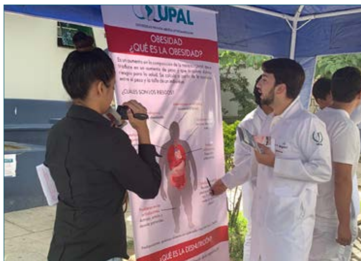
Uno de nuestros estudiantes explica ante las cámaras las implicaciones de la Obesidad en la salud.