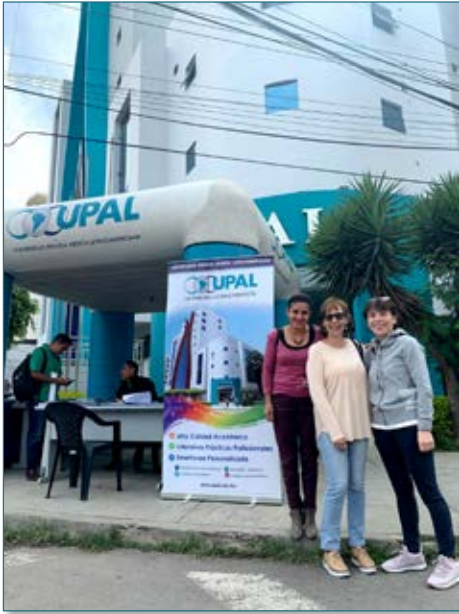
Personal de la Institución “Amigos del Padre Berta”, que trabaja en la zona con familias de escasos recursos, asistiendo a la Feria.