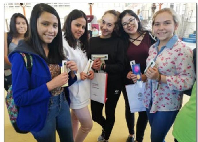
Estudiantes del Colegio Federico Froebel en un encuentro con la UPAL