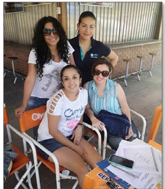
Nuestro equipo de Bienestar Universitario.