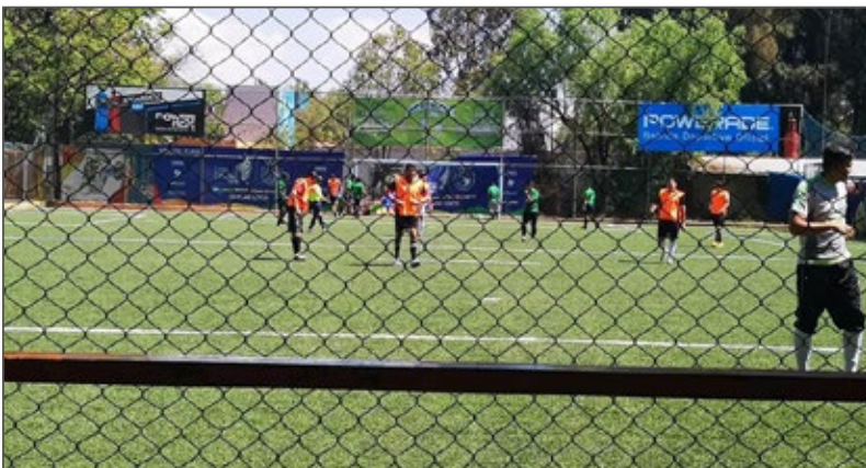
Imágenes de los primeros partidos de Voley y Fútbol de la temporada.