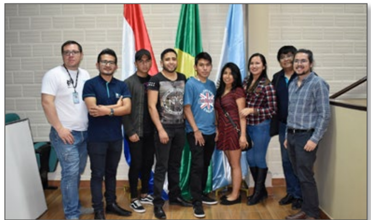
Algunos de nuestros estudiantes que participarán en el Festival "The 48 Hour Film Project", acompañados de sus docentes y el Responsable del Festival en Cochabamba