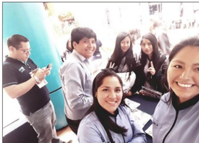
Estudiantes y Docentes de la UPAL compartiendo con estudiantes de secundaria de municipios del Valle Alto.

La primera actividad de este ciclo de Ferias Profesiográficas permitió llegar alrededor de 2.800 bachilleres de unidades educativas del Valle Alto.